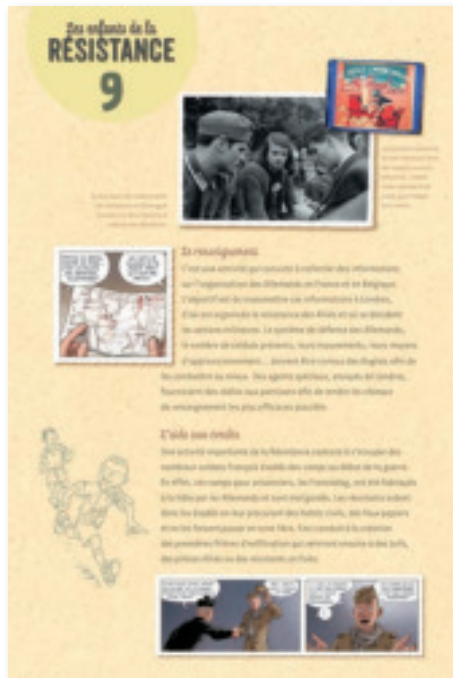
Panneau 9 : La Résistance – C