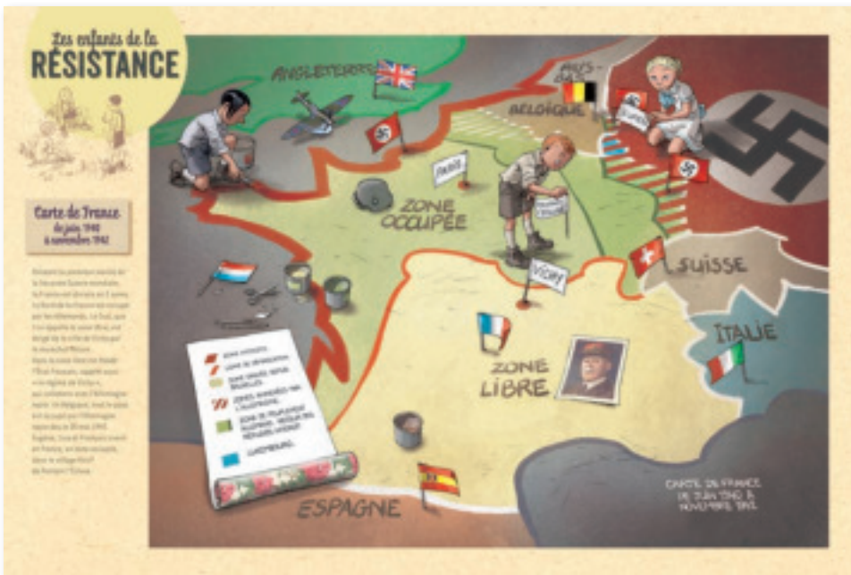
Panneau B : Introduction à la Seconde Guerre Mondiale (période : de juin 1940 à novembre 1942)