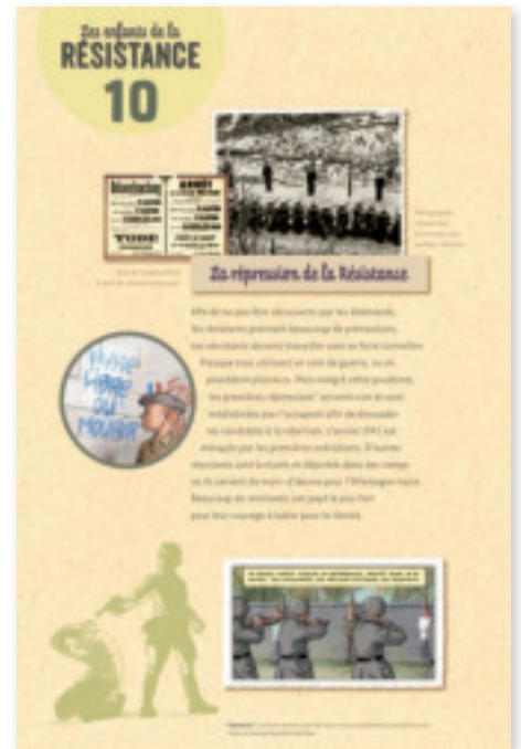
Panneau 10 : La Répression de la Résistance