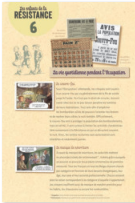
Panneau 6 : La Vie quotidienne sous l'Occupation