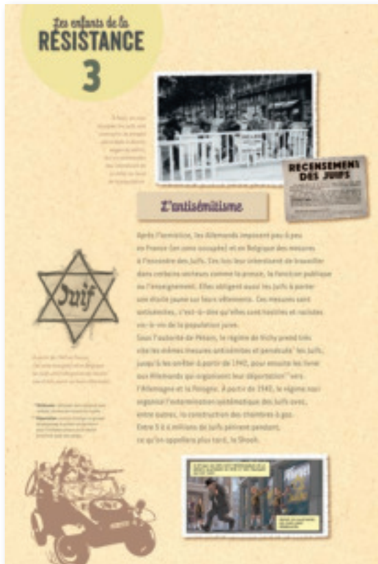
Panneau 3 : L'Antisémitisme