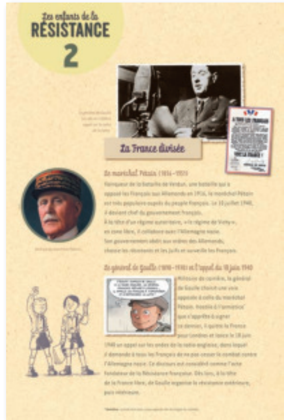
Panneau 2 : La France divisée