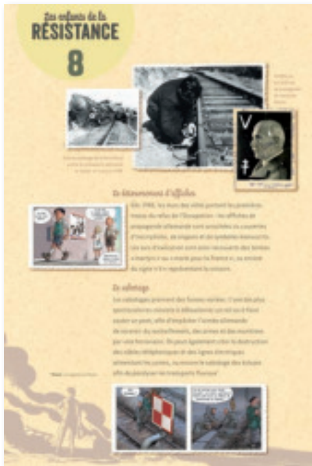
Panneau 8 : La Résistance – B