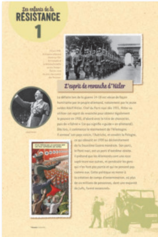
Panneau 1 : L'Esprit de revanche d'Hitler

10 bâches de 600x900 mm avec réglettes en bois en haut et en bas, soit 20 réglettes