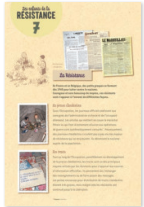
Panneau 7 : La Résistance – A