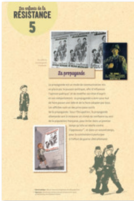
Panneau 5 : La Propagande