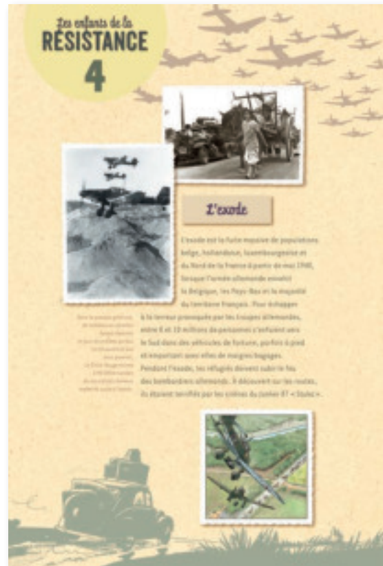
Panneau 4 : L'Exode