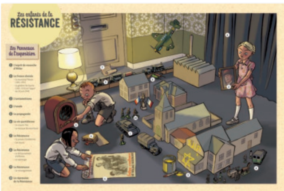
Panneau C : Les thèmes de l'exposition