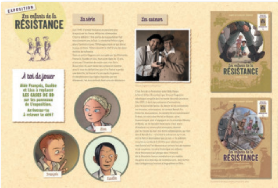
Panneaux de présentation : 3 bâches de 1200x800 mm avec réglottes en bois en haut et en bas, soit 6 réglottes